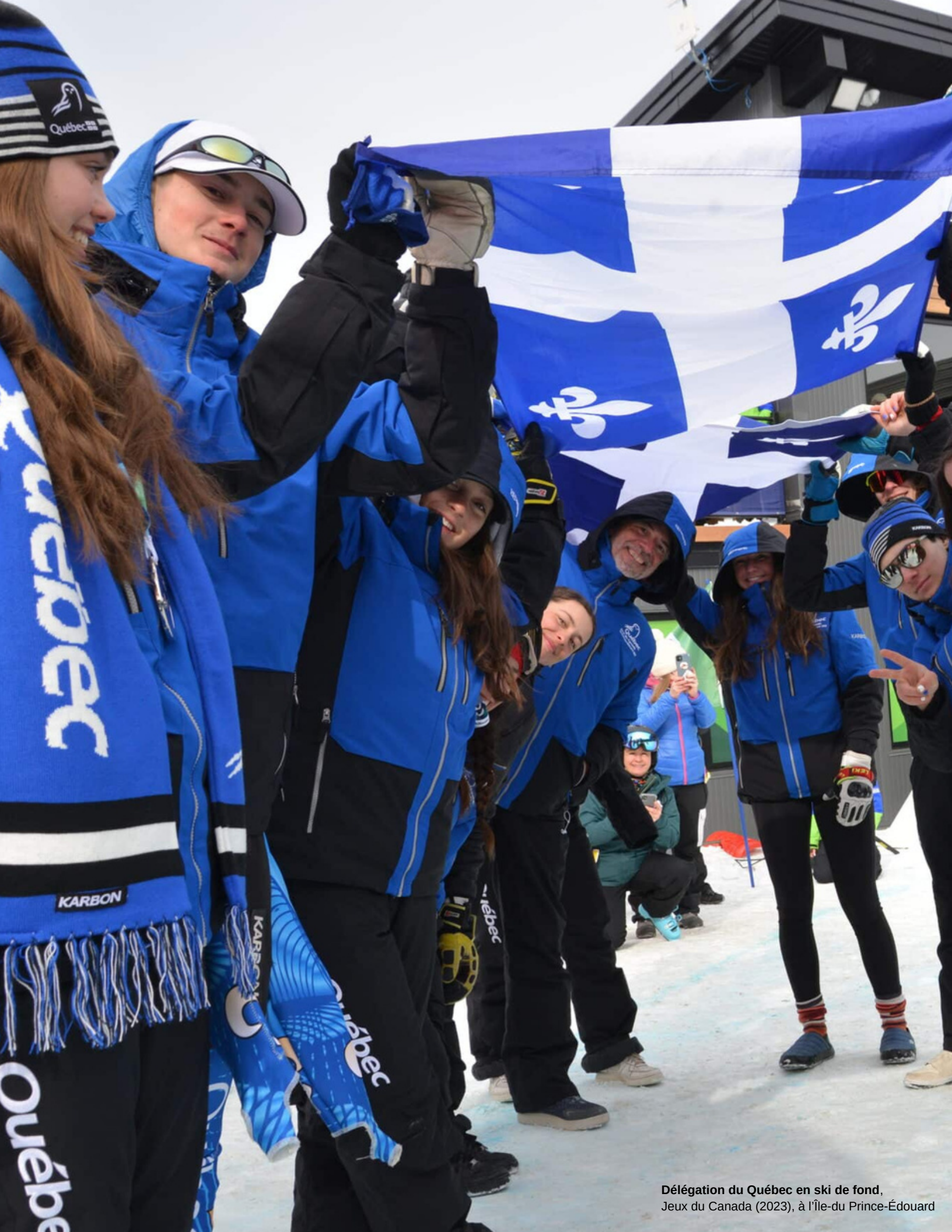
Délégation du Québec en ski de fond, Jeux du Canada (2023), à l'Île-du-Prince-Édouard